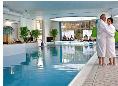
Die QuellenTherme lädt zum Ein- und Abtauchen ein.