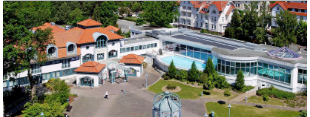
Das Göbel's Hotel AquaVita in Bad Wildungen aus der Vogelperspektive.

Dieses Angebot wurde ermöglicht durch SPANESS. Der Preis ist gesponsert und nicht aus Mitgliedsbeiträgen finanziert. Gewinnerr (WIR 1/2016): ????? ????????